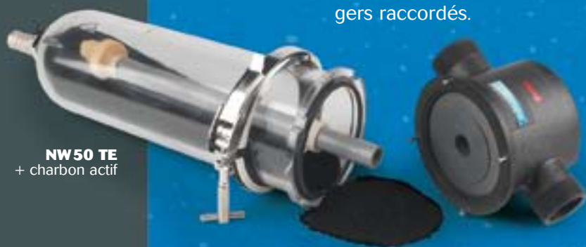
NW50 TE + charbon actif

Vendu séparément, le charbon actif CINTROPUR® SCIN supprimera les goûts et les odeurs de l'eau. Il réduira le chlore et les micro-polluants tels les pesticides et les substances organiques dissoutes.